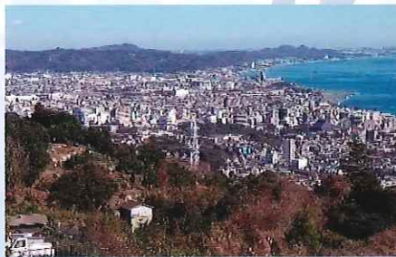
【小田原市街】石垣山城跡から見た眺望